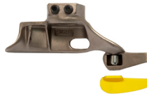
Front head protection (x2)